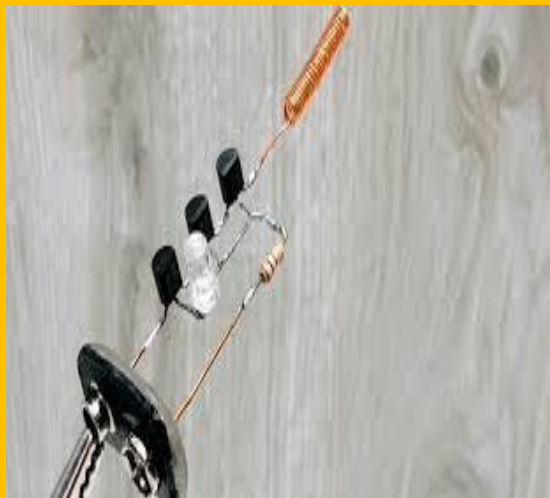
Elektr sezuvchi detektor