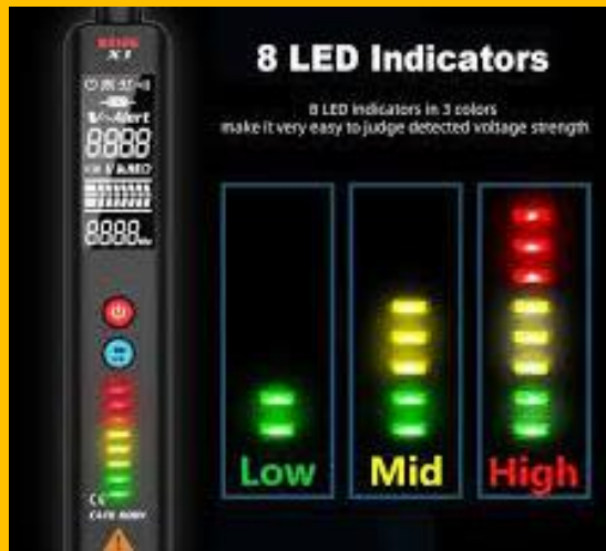
Kuchlanishni ko'rsatuvchi chiroq hamda ovozli ogohlantiruv