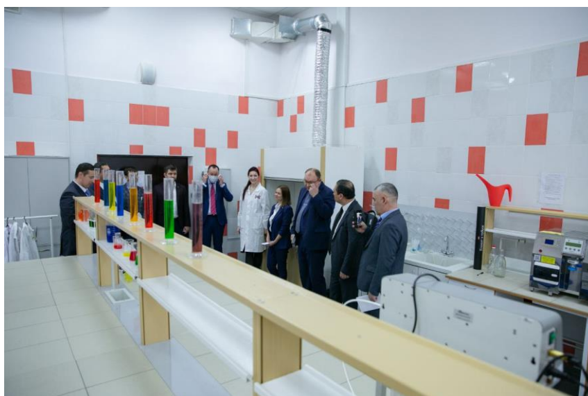
“Менделев центр” га таширф.