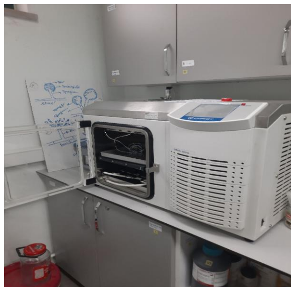
6.12.2022 куни YТУ Давутпаша кампусига саёхат уюштирилди.