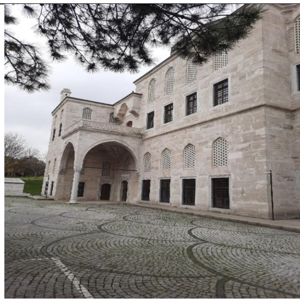
7.12.2022 куни YТУ-Озиқ-овқат муҳандислиги кафедраси аъзолари ва ТКТИ - Озиқ-овқат маҳсулотлари технологияси кафедраси аъзолари ўртасида мумкин бўлган лойиҳа ҳамкорликлари бўйича учрашув ўтказилди.